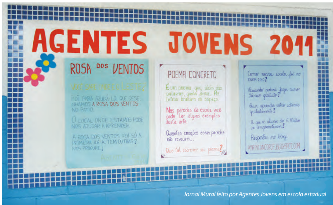
Jornal Mural feito por Agentes Jovens em escola estadual

quanto mais estudantes envolvidos, melhor. A diversidade do perfil desses estudantes também é importante, uma vez que esse grupo vai operar diferentes ferramentas. Assim, é ideal que haja entre os integrantes habilidades para comunicação verbal e escrita, habilidades artísticas, organização de eventos e muita criatividade.