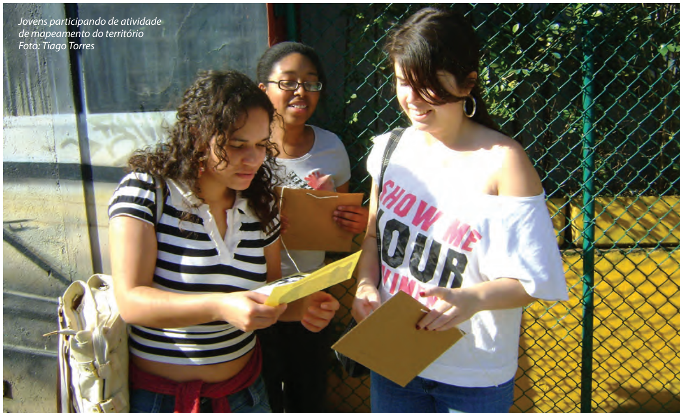
Jovens participando de atividade de mapeamento do território

Munidos com os recursos de comunicação disponíveis na escola (câmeras fotográficas, filmadoras, gravador de áudio), além de papéis, canetas e a parte do mapa destinada ao grupo, os educandos, divididos nos respectivos grupos, deverão percorrer o caminho acordado com o educador a fim de reconhecer os espaços, as pessoas e os veículos de comunicação local que possam contribuir com as necessidades da escola e a proposta de comunicação.