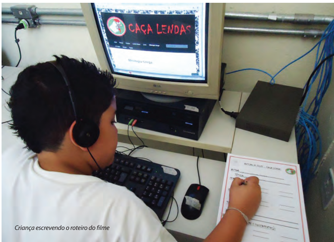
Criança escrevendo o roteiro do filme

pesquisa. Nesse processo o educador pode realizar uma avaliação diagnóstica sobre o que os educandos já conhecem daquele assunto – o que é denominado marco zero.