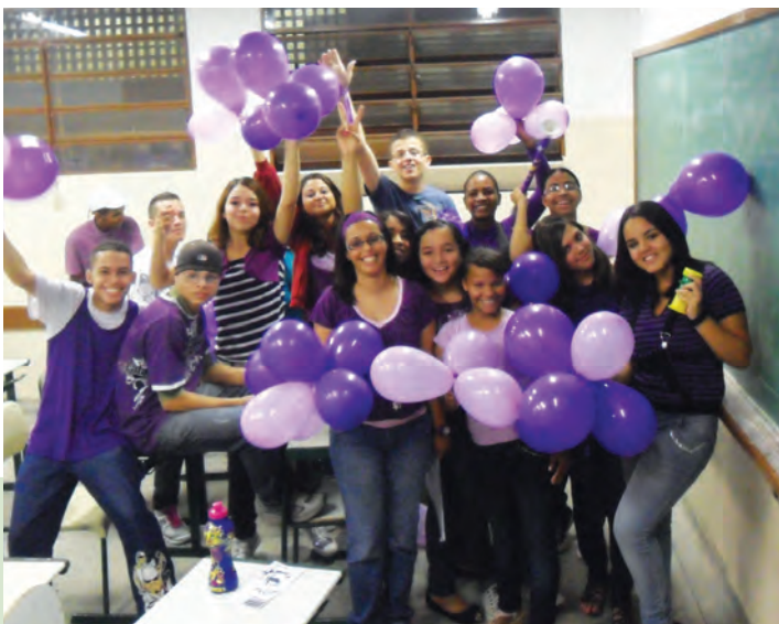
Agentes Jovens de escola estadual

sobre o fazer comunicativo como em relação à abertura de canais de comunicação para que todos possam ter o direito à expressão de sua realidade.