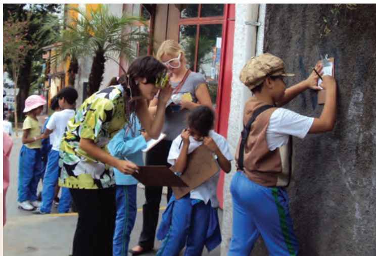
Pesquisa pelo bairro